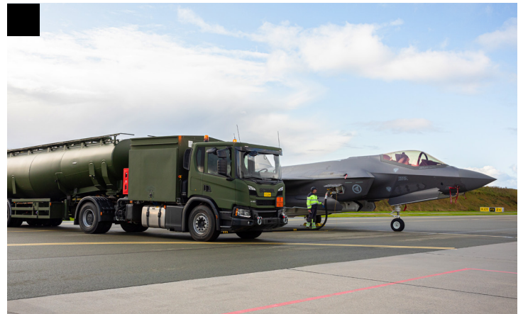
1. For å bygge kompetanse om svermteknologi bør Forsvaret utvikle, eksperimentere og teste hvordan autonomi fungerer under norske forhold. 2. Langtidsplanen gir handlefrihet, blant annet for valg av fregattklasse. 3. Klimautslipp kan reduseres gjennom bruk av for eksempel bærekraftig flydrivstoff (sustainable aviation fuel – SAF).

Forsvarsanalysen 2025 er den fjerde utgaven i sitt slag. FFI bruker her hele sin faglige bredde til å gi forsvarsledelsen råd om den strategiske utviklingen av Forsvaret. Analysen er et produkt av FFIs prosjekt «Strategiske forsvarsanalyser», som etter ønske fra forsvarssjefen ble opprettet i januar 2021.