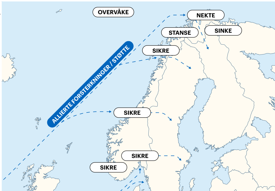
Eksempel på operativt konsept.